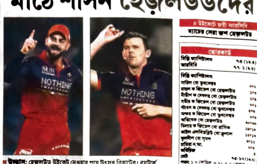
উদ্যম: হেজলউড উইকেট নেওয়ার পরে উৎসব বিরাটের। হরটোল