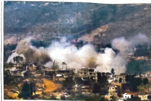
দক্ষিণ সোমানের ইজরায়েল-সীমান্তবর্তী এলাকা লম্বে ইজরায়েলি হামলা। ছবিতে, আল-নুসরা বাহিনী তার ঘোঁরা সুপ্তাঙ্গী। গভিরা দক্ষিণ সোমানের সীমান্ত বন্ধ করে রাখা হয়েছে।

এই মতো, দুর্ভাগ্যবশত আলোচনা নিয়ে প্রতিবেদী উপসংহারে দেশগুলিকে সঙ্গী করতে হলেও, শেখের কাছে প্রেরিত একটি সন্মতনামায় হরমুজের ইরানিরা সুরে কয়েকটি দাবি করেছেন। যদি ইরানের দাবি মেনে নেওয়া হয় তবে তিন দফার প্রস্তাব মেনে নিতে হবে। ইরানের প্রস্তাবিত তিন দফার মধ্যে প্রথম দফা হলো, ইরান ও ইরানের পরেই পাকিস্তানি আক্রমণের জন্য কোনও দায়িত্ব চালাবে না আমেরিকা। এ প্রতিশ্রুতিতে ইরান ট্রাম্প প্রশাসনের দিকে তেমন আগ্রহ রাখে নিতে পারে।