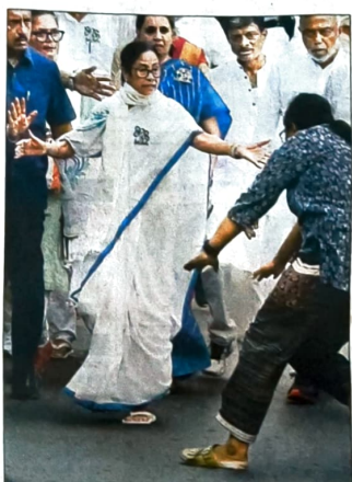
■ মমতাপুুরে সন্ধ্যায় মুখমন্ত্রী মমতা বন্দোপাধ্যায়।

প্রায় এক মাসে তিন দিন ধরে শিঙ্গিঙি থেকে সাগর পর্যন্ত কম-বেশি ২০০টি কর্মসূচি ছিল কংগ্রেস নেত্রীর। প্রথম মমতা ভোটারে জ্ঞানবলির পরে, শেষ কয়েক দিন বিজয় বন্ধন কংগ্রেসি মুখে ৪ দিন মতিন কলকাতার প্রচার শেষ করেছেন মমতা। সুসংগত থেকে ভাটপাড়া, গোলাপাট থেকে পড়িয়াহাট ও হাঙ্গরা থেকে গোলাপনগর পর্যন্ত ৪ দিন তিন