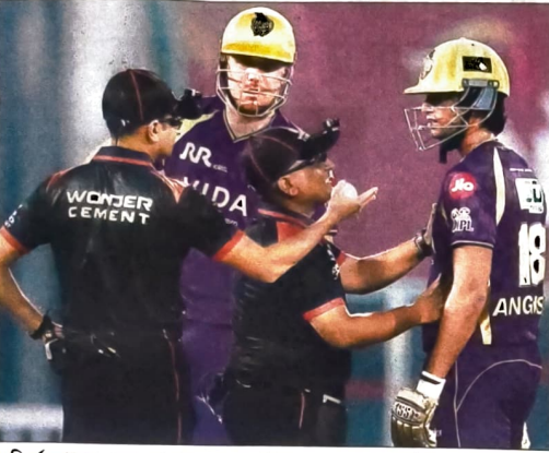
বিতর্ক: আউট নেওয়ার পরে আম্পায়ারের সঙ্গে তর্কে জড়িয়ে পড়েন অঙ্গকূশ। পাশে ত্রিম। ফাইল চিত্র