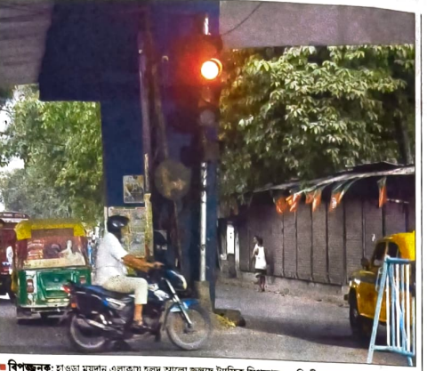
বিপজ্জনক: হাওড়া ময়দান এলাকায় হতদুঃখী মানুষেরা হাওড়া ট্রাফিক সিগন্যালে।